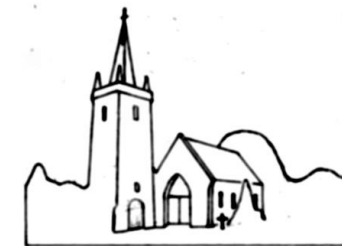
Amis de la CHAPELLE SAINT-LOUIS CARTERET

Avec le soutien de la Fondation du Patrimoine, cette œuvre de longue haleine se poursuit avec, entre autres, les résultats suivants: