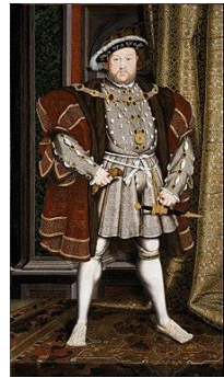
Henry VIII 1509-1547