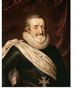
Henri IV 1589-1610