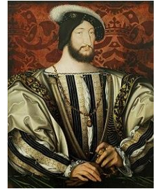
François 1 er 1515-1547

Sous ce contrat, l'adjudicataire a l' usufruit de la terre contre redevance annuelle au Trésor royal.