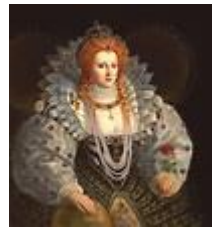
Elisabeth 1 er 1558-1603